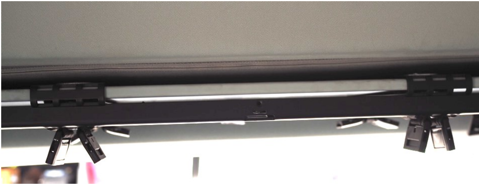
Blick von Innen auf die U-Klammer.